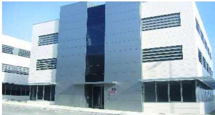
IMAGEN DE LA SEDE DE SEIN EN EL POLÍGONO DE MUTILVA BAJA

sociedad de nuestro territorio con esos galardones "lo que es muy importante ya que en el caso de las Workstations estamos hablando de empresas que presentan un mayor grado de complejidad", recordaron desde Mutilva Baja.