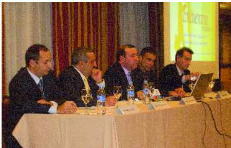
IMAGEN DEL RECIENTE ENCUENTRO ORGANIZADO POR SINERGIUM CON SUS CLIENTES