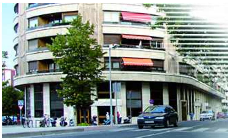
ASENA IMPULSA EN NAVARRA LA CULTURA DE UNA NUEVA FILOSOFÍA RETRIBUTIVA, EL EFLEX

estrategias retributivas que atraigan, mantengan y motiven a los mejores profesionales. Proporcionar el mismo paquete de beneficios a todos los empleados no es la forma más eficaz de responder a las diferentes necesidades individuales. Por este motivo está en aumento el número de empresas que deciden proporcionar a sus profesionales una cierta capacidad de elección sobre la composición de su retribución. Conscientes de la importancia de atraer y mantener a sus profesionales, las empresas que se encuentran en van-