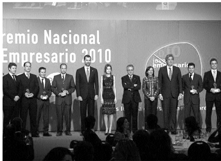
DIAGO RECIBIÓ EL GALARDÓN DE MANOS DE S.A.R. EL PRÍNCIPE DE ASTURIAS, QUIEN DESTACÓ QUE LA APORTACIÓN DE LOS JÓVENES EMPRESARIOS A LA ECONOMÍA ESPAÑOLA ES FUNDAMENTAL

La elección del premiado corre a cargo de un jurado independiente, compuesto por varias personas de reconocido prestigio, que valora y elige los proyectos que concurren destacando la consolidación del desarrollo de su negocio, así como haber contribuido de forma especial a la creación de riqueza en su entorno y a la generación de empleo en nuestra sociedad.